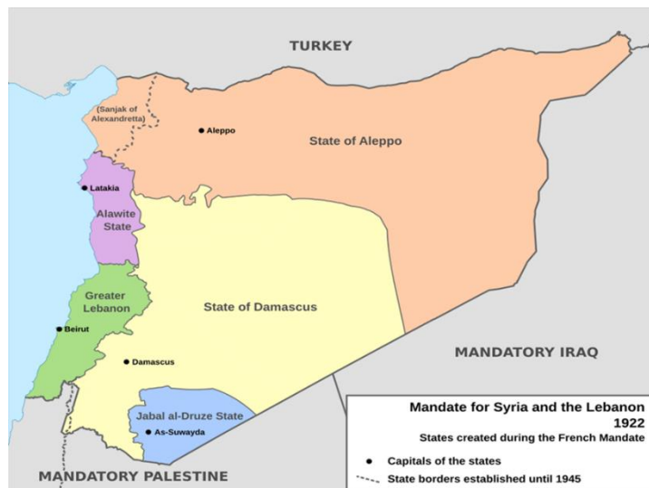
نقشه شماره ۱: جایگاه هاتای در نقشه سوریه

در پنج دسامبر ۱۹۳۸ م. اولین کابینه پنج نفره وزاری ترک بدون حضور اعراب مشغول به کار شد. قانون اساسی هاتای در هفت دسامبر ۱۹۳۸ م. پذیرفته شد و سرود ملی ترکیه به عنوان سرود ملی هاتای برگزیده شد، امور خارجه هاتای در اختیار سوریه باقی ماند و اداره گمرک مشترکاً توسط ترکیه و سوریه اداره می‌شد، پول رایج در هاتای نیز لیر سوریه تعیین شد (کریمی، ۱۴۰۲: ۸۰).