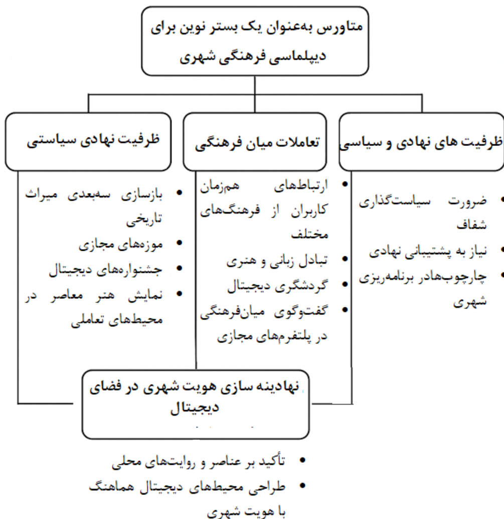
شکل ۱. مقوله‌های محوری مرحله کیفی پژوهش در ارتباط متاورس و دیپلماسی فرهنگی

یافته‌های جدول ۱ نشان می‌دهد که مفاهیم اولیه (کدهای باز) پس از ادغام در قالب پنج مقوله محوری دسته‌بندی شدند و در نهایت به یک مقوله انتخابی مرکزی با عنوان «متاورس به مثابه بستر نوین دیپلماسی فرهنگی شهری» ختم شدند.