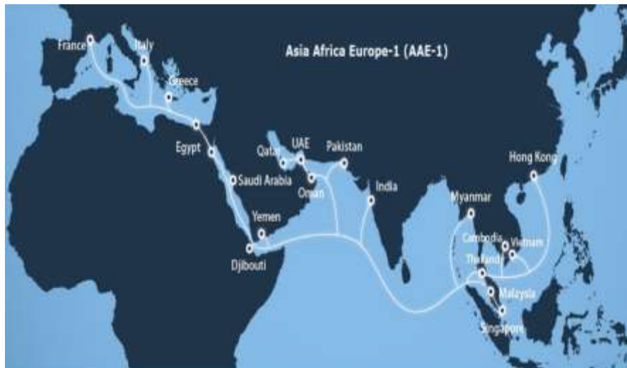
شکل ۲. کابل آسیا آفریقا اروپا-۱

این سیستم کابلی، یک پروژه کنسرسیومی ۲۵ هزار کیلومتری است که جنوب شرق آسیا را از طریق مصر به اروپا متصل می‌کند و بزرگ‌ترین کابل زیردریایی ساخته‌شده در نزدیک به ۱۵ سال گذشته محسوب می‌شود. مسیر آن از هنگ‌کنگ آغاز شده و از عربستان سعودی عبور کرده و سرانجام به یونان، ایتالیا و فرانسه می‌رسد. پروژه توسط چین یونیکام در سال ۲۰۱۱ با همکاری و حمایت مخابرات مصر آغاز شد (AAE 1, 2016). این کابل طولانی‌ترین سامانه زیردریایی در بیش از یک دهه گذشته است (Light Wave Online, 2017). در شکل زیر، مسیرهای کابل زیردریایی مذکور نشان داده شده است: