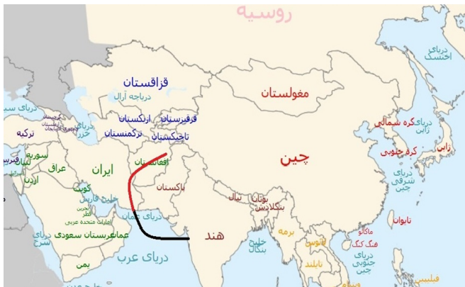
نقشه شماره ۱: مسیر ترانزیت هند به آسیای مرکزی

۱۳۹۳: ۱۳۹ (درباره بندر چابهار هم می‌توان گفت هند سرمایه‌گذاری زیادی روی توسعه بندر چابهار انجام داده است زیرا این بندر هند را به بازارهای اوراسیا وصل می‌کند (Drishti.com, 2019)). با احداث و راه‌اندازی بزرگراه زرنج-دلارام این امکان در کشور افغانستان به وجود آمد که کالاها از شهرهای اصلی افغانستان و از طریق زمینی به سمت مرزهای ایران ارسال و از آنجا به چابهار و برعکس منتقل شوند. این بزرگراه، افغانستان محصور در خشکی را به شاه‌رگ حیاتی ارزشمندی تبدیل کرده است. در گذشته راه دستیابی افغانستان به دریا از طریق پاکستان و از مسیر پیشاور به سمت بندر کراچی بود که عبور از این جاده از مسیر پاکستان مشکلاتی را برای افغانستان ایجاد می‌کرد. پاکستان اغلب ارسال کالاهایی که برای بازسازی افغانستان ارسال شده بود را به تأخیر می‌انداخت. اما اکنون بزرگراه زرنج-دلارام گزینه جدید و مناسبی برای افغانستان محسوب می‌شود (دهقان و دیگران، ۱۳۹۷: ۱۵۹). کشور هند از طریق این جاده می‌تواند محصولات و کالاهای خود را به افغانستان رسانده و در آنجا به فروش برساند. همچنین هند می‌تواند از طریق این جاده به کشورهای آسیای مرکزی متصل شده و با به دست‌گیری بازارهای پر تقاضای این کشورها بخشی از محصولات خود را در این منطقه بفروشد و متقابلاً انرژی مورد نیاز خود (گاز و اورانیوم) را از این منطقه تأمین کند.